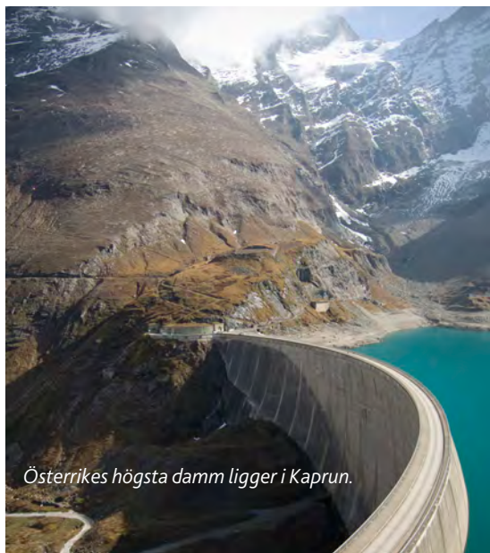
Österrikes högsta damm ligger i Kaprun.