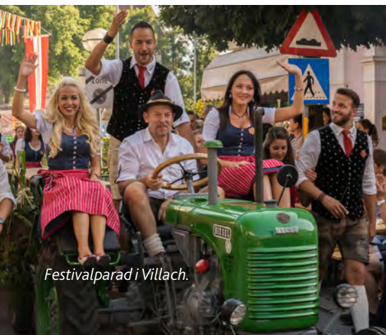
Festivalparad i Villach.

Från Lienz fortsätter du mot Villach och Klagenfurt . Se beskrivningen av vägen via Felbertauerntunneln ovan.