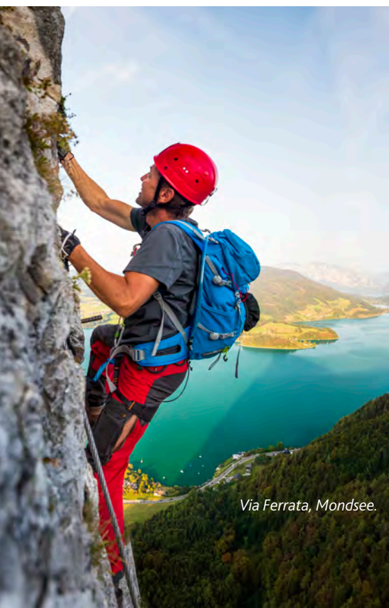
Via Ferrata, Mondsee.