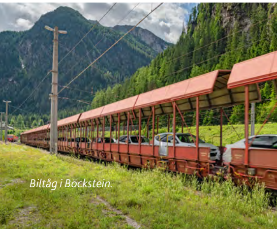
Biltåg i Böckstein.

Sträckan Spittal–Villach, se vägen genom Felbertauern-tunneln på föregående sida.