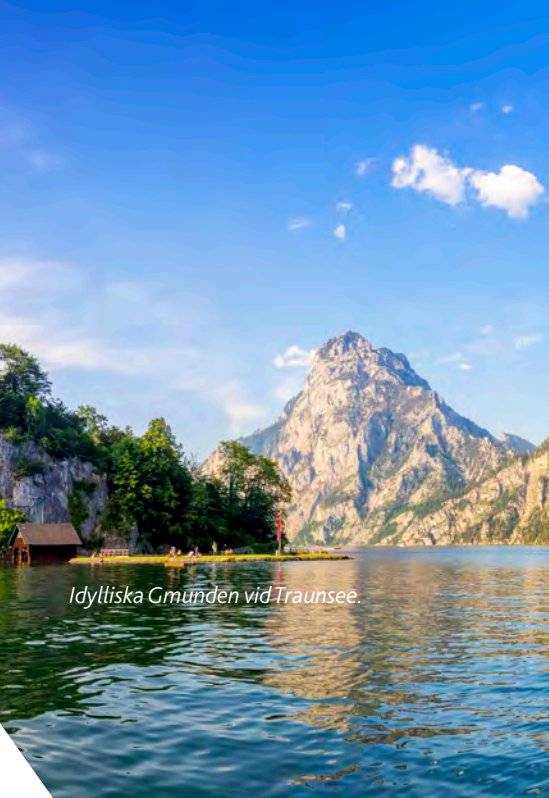
Idylliska Gmunden vid Traunsee.