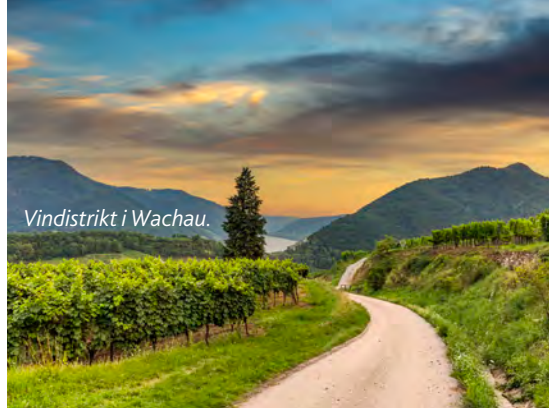
Vindistrikt i Wachau.