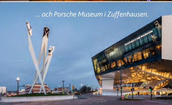
... och Porsche Museum i Zuffenhausen.