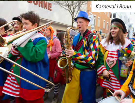
Karneval i Bonn.