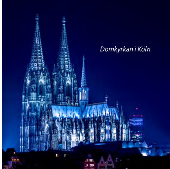
Domkyrkan i Köln.

Köln är värd en dag eller två. Berömd domkyrka och trivsamma centrumkvarter. Fina museer, bra krogar. En flaska väldoft, Kölnisch Wasser 4711, står nog på shoppinglistan.