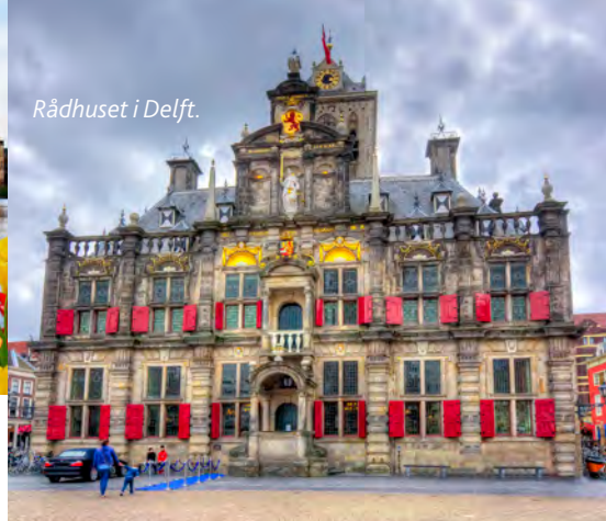
Rådhuset i Delft.

Vägen mot Europoort kantas av hamnbassänger, oljeraffinerier och industrier. Brielle är en verklig kontrast, här härskar idyllen.