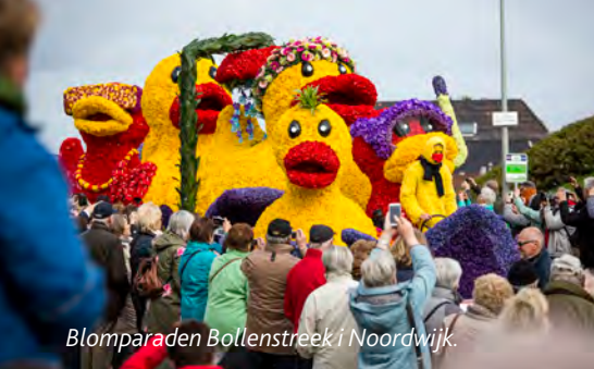
Blomparaden Bollenstreek i Noordwijk.

Smaka rökt sill i hamnen i Monnickendam och lyssna till klockspelet från Speeltoren. Kör till Marken som var en ö fram till 1957.