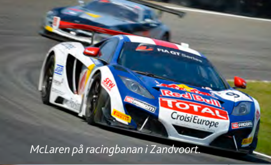
McLaren på racingbanan i Zandvoort.