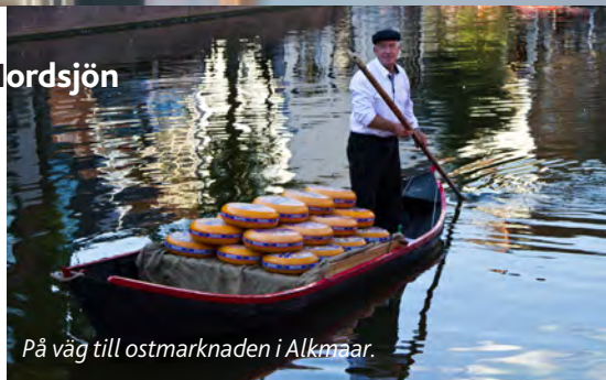
På väg till ostmarknaden i Alkmaar.

Franeke ligger väster om Leeuwarden. Eise-Isingas planetarium är världens äldsta. Färjor till de friska öarna avgår från charmiga Harlingen .