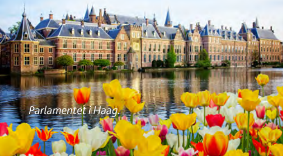
Parlamentet i Haag

Haag är säte för kungafamilj, regering och riksdag. Elegant, lite förnämt, men ändå avspänt. Bra shopping. Se riksdagshuset Binnenhof med riddarsal från 1200-talet, Mauritshuis med en fin samling 1600-talskonst och ryktbara fängelset Gevangenpoort. Haags skyline med stiliga skyskrapar bildar en effektiv bakgrund.