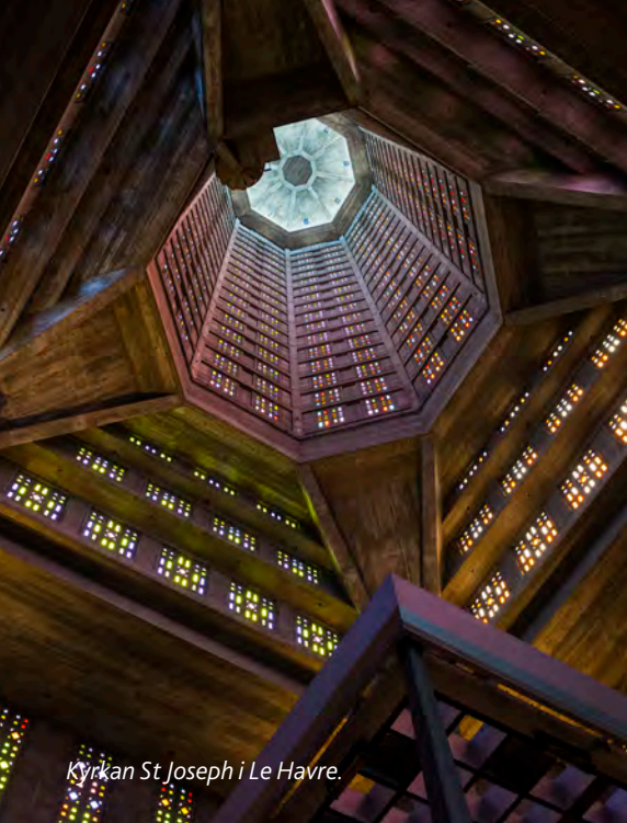
Kyrkan St Joseph i Le Havre.