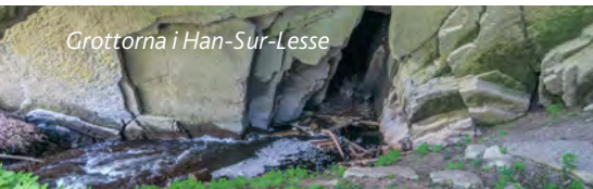
Grottona i Han-Sur-Lesse

Välkända champagnemärken välkomnar i Reims . Turistvägen Route du Champagne leder till vinbyarna. I Épernay har Moët & Chandon 100 miljoner flaskor lagrade i 28 km långa gångar, tre våningar under jord.