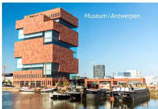
Museum i Antwerpen.

Genom Boulonnais-området öster om Boulogne går flera idylliska småvägar. Ett annat vackert stråk följer floden Course, från Desvres till Montreuil .