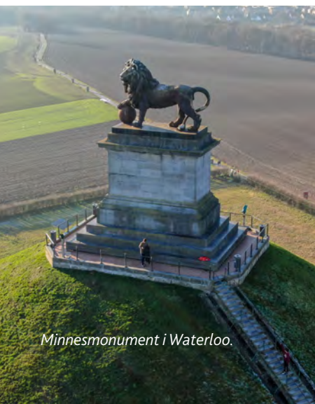
Minnesmonument i Waterloo.

Fortsätt in i Frankrike förbi Douai till Arras . Här böljade skyttegravskriget fram och tillbaka åren 1914–1918. Många minnesmärken och krigskyrkogårdar.