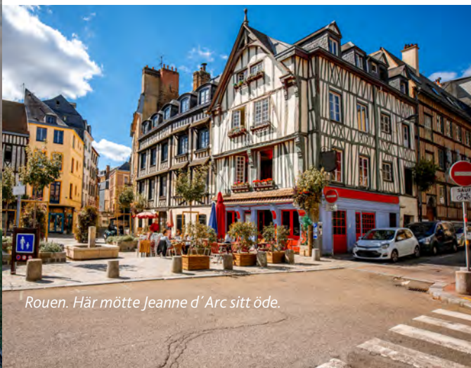
Rouen. Här mötte Jeanne d'Arc sitt öde.

Betongkramare gillar Le Havre . Kyrkan St Joseph imponerar, annars är det mesta grått och fyrkantigt. Mäktiga bron Pont de Normandie leder över till Honfleur med pittoreska gränder och turister i mängder. Pont-Audemer är mer stillsamt med kanaler och korsvirkeshus som klättrar uppför flodsluttningen.