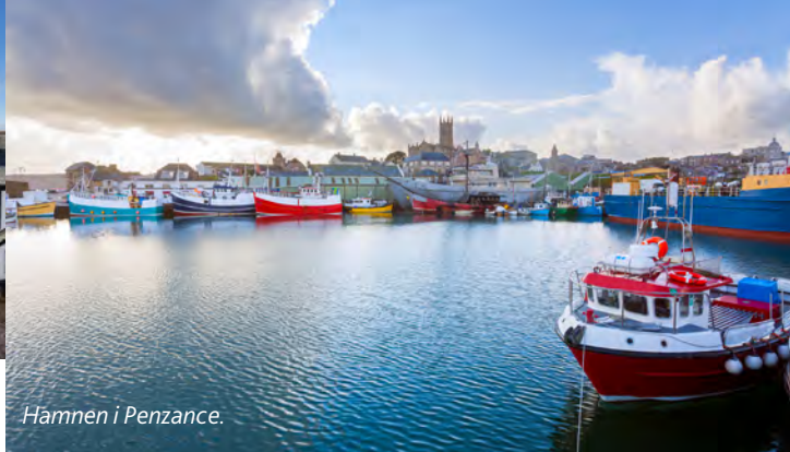
Hamnen i Penzance.

Englands första kloster grundades i Glastonbury på 600-talet. Här finns en törnrosbuske som blommat ända sedan dess. 1300-talshotellet George & Pilgrim härbärgerar förutom hotellgäster också flera spöken.