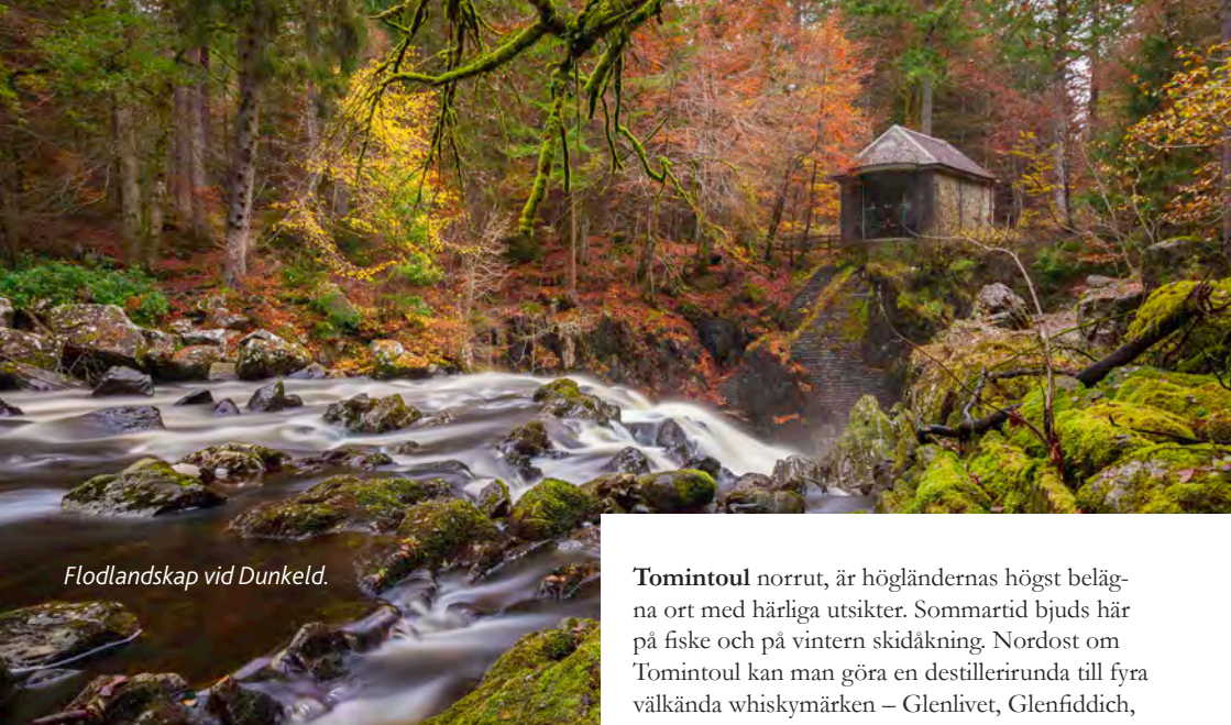
Flodlandskap vid Dunkeld.

Perth är belägen vid floden Tay och var till mitten av 1400-talet Skottlands huvudstad. Trevlig strandpromenad längs Tay Street och vackra vyer från Kinnoull Hill. I Scone Palace norr om Perth kröntes de skotska kungarna. Kröningsstenen rövades bort av engelsmännen redan 1297. Den finns nu i Westminster Abbey i London.