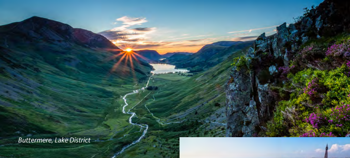
Buttermere, Lake District

Penrith i frodiga Eden Valley välkomnar med trevliga röda hus byggda av sandsten. Jättegraven Giant's Grave är en kuriositet på kyrkogården.