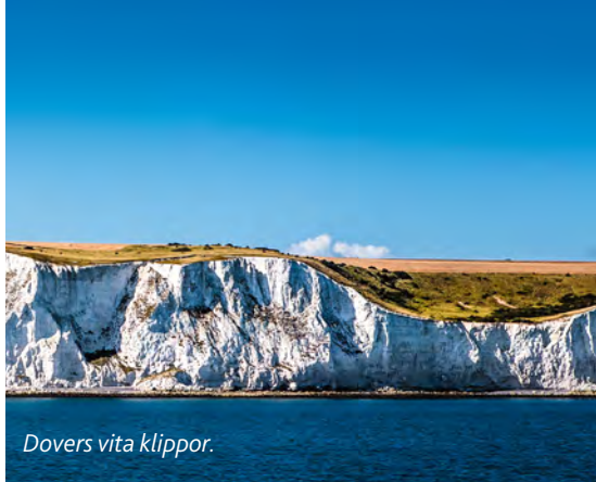
Dovers vita klippor.

Residensstaden i Sussex är Lewes och belägen vid en gammal borg. Många vackra miljöer från äldre tider.