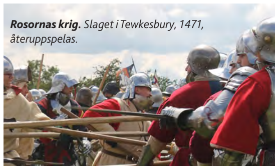
Rosornas krig. Slaget i Tewkesbury, 1471, återuppspelas.

Från Cheltenham fortsätter du förbi Cirencester och Swindon tillbaka till London.