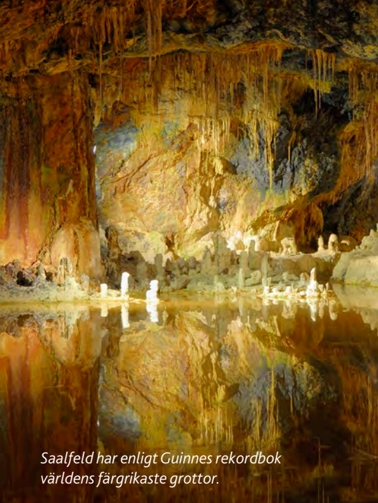
Saalfeld har enligt Guinnes rekordbok världens färgrikaste grottor.

Väg 88 leder söderut, förbi Dornburg till kamera- och optikstaden Jena . Gör en avstickare till Goethes och Schillers Weimar . Eller till Erfurt med ståtliga kyrkor och berömda Krämerbrücke, en medeltida bro med trähus ovanpå.