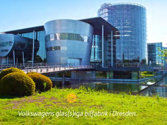
Volkswagens glas(s)iga bilfabrik i Dresden.

Dresden låg i ruiner 1945. Somligt är återskapat, med blandat resultat. Frauenkirche invigdes så sent som 2006. Flera fina konstmuseer i slottet Zwinger. Se också Gläserne Manufaktur, Volkswagens genomskinliga bilfabrik i glas.