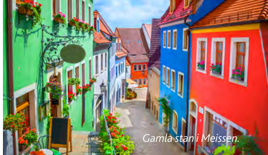
Gamla stan i Meissen.

I Plzeň släcks törsten med pilsner. Mest känd är Prazdroj (Urquell), fler sorter finns. Plzeň är en lite pompös storstad. Rokycany är mer lagom. Vackra hus och trivsamt atmosfär.