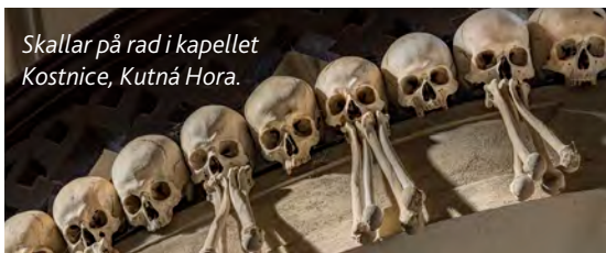
Skallar på rad i kapellet Kostnice, Kutná Hora.

Nästa stopp blir i Velké Meziříčí , nära motorvägen. Vackert torg, ringmur och stadsportar. Några mil söderut Třebíč , som också är en sevärd stad.