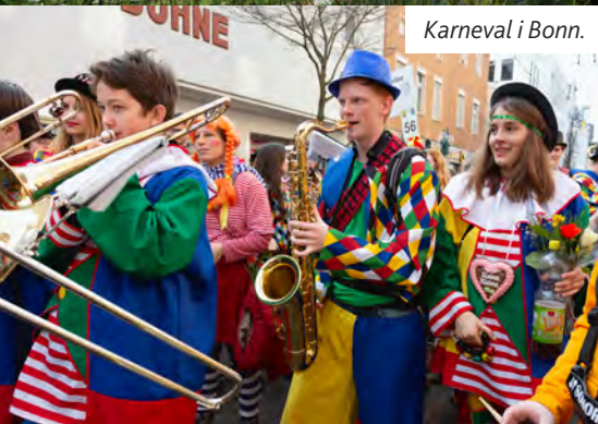
Karneval i Bonn.