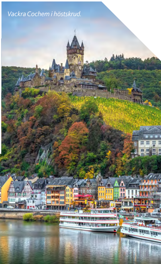
Vackra Cochem i höstskrud.

Mainz och Wiesbaden ligger mitt emot varandra där Main flyter ut i Rhen. Mainz domkyrka uppfördes runt år 1000. Wiesbaden är både storstad och kurort. Stiligt Kurhaus, hälsobrunnar och badanläggningar som Kaiser Friedrich-Therme. Upp till Neroberg går en bergbana.